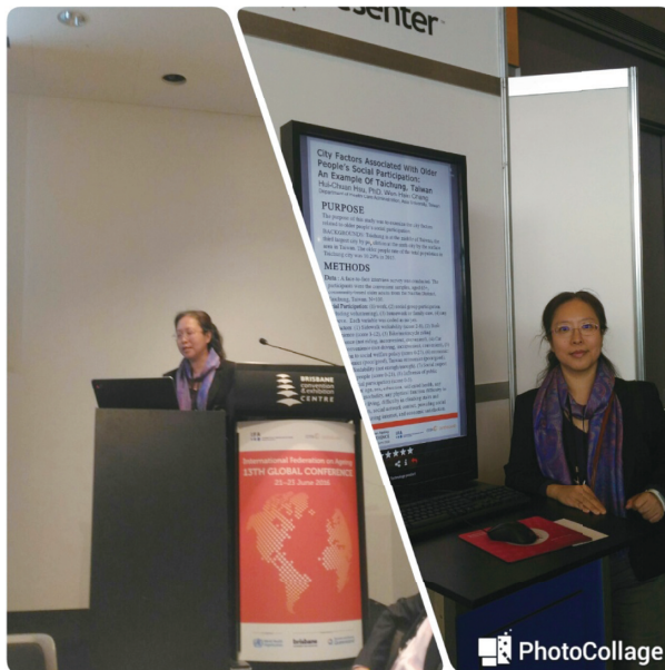
圖2 作者參與口頭報告與電子海報