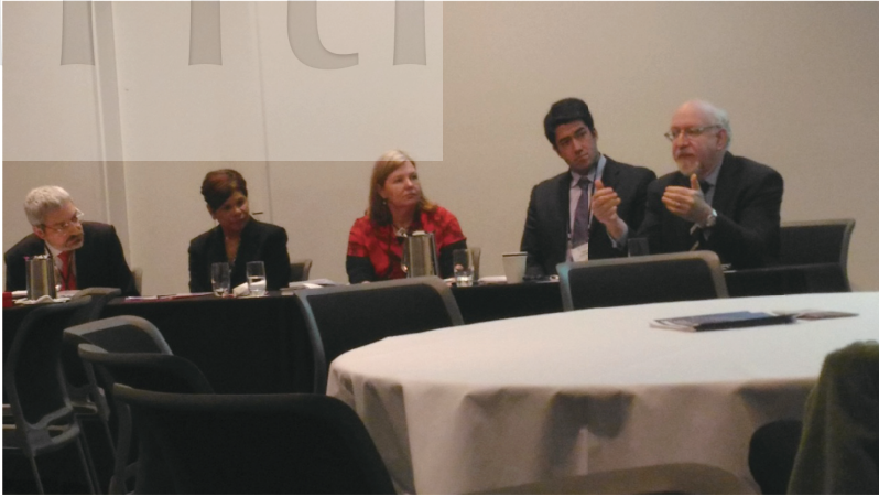
圖3 三個城市正副市長與世界衛生組織代表談高齡友善城市政策經驗

通、如何鼓勵老年人進行有趣的活動達到身體活動的效果等。然而這些活動與計畫若能搭配嚴謹的研究設計證明其成效，在推動上會更有利。